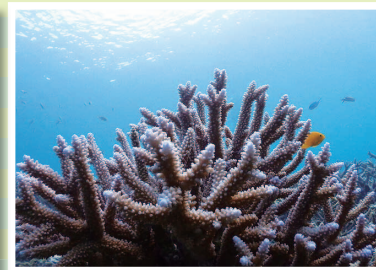
ヨナラ水道のサンゴ礁

石垣島では「オーバーツーリズム」が大きな問題となっています。度重なる開発計画への反対運動から見えてきた観光の未来とは。 (本誌五七頁)