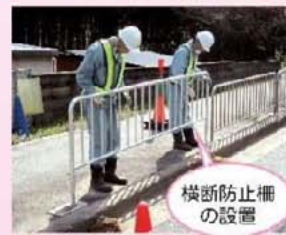
横断防止柵の設置