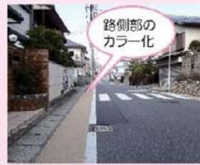
路側部のカラー化