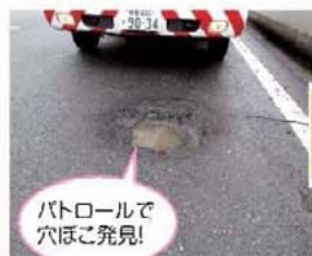
パトロールで穴ぼこ発見!