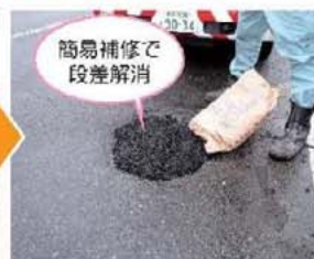
簡易補修で段差解消