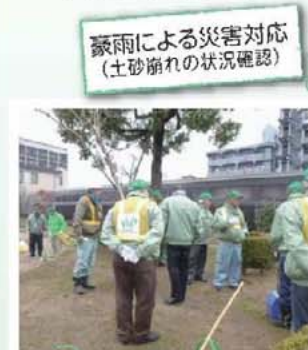
豪雨による災害対応(土砂崩れの状況確認)