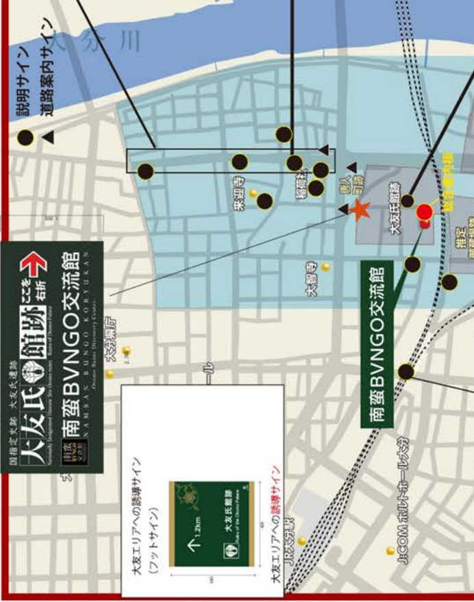
大友エリアへの誘導サイン (フットサイン)