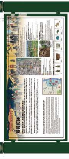
大友グリーン+花文様

■大友氏遺跡 (大友氏館跡・旧万寿寺地区・上原館跡) 大友家の格式をイメージしたデザイン