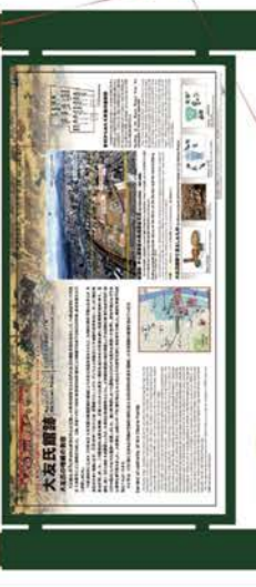
大友グリーン+家紋

■大友氏遺跡 (大友氏館跡・旧万寿寺地区・上原館跡) 大友家の格式をイメージしたデザイン